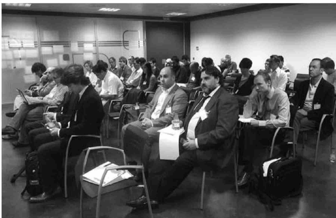
Asistentes a las jornadas informativas sobre la incubadora de aplicaciones. DN

"La crisis nos ha servido para ver que tenemos que funcionar de otra forma, innovar, anticiparnos a lo que quieren nuestros grupos de interés" dijo Barbarin. Villanueva, por su parte, añadió que la crisis ha tenido el "efecto beneficioso" de consolidar los equipos al frente de estas entidades. "Se ha eliminado esa gran movilidad que habían antes, de estar aquí mientras me sale algo o me presento a tal oposición".